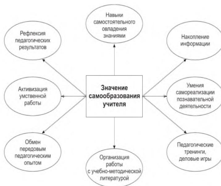
Схема 2. Значение самообразования педагога

Овладение методикой организации самообразовательной деятельности происходит через определенные этапы. Работа с педагогическими кадрами в системе последиplomного педагогического образования начинается с этапа входного диагностирования , целью которого является изучение степени развития между реальным уровнем овладения профессиональными умениями по указанным вопросам и критериями. Изучение педагогической деятельности, выявление основных трудностей проводится с помощью методов анкетирования, собеседования, опроса, тестирования и т. д.